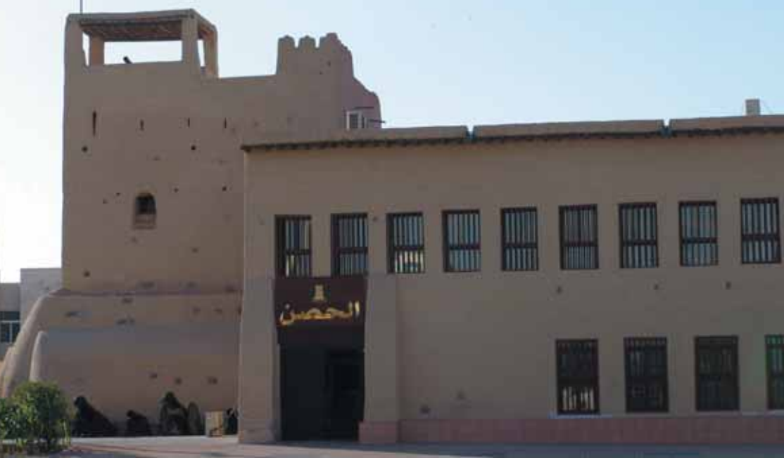
Sehenswürdigkeiten in Ras Al Khaimah-Stadt: das Nationalmuseum (oben) und die größte Moschee (unten)