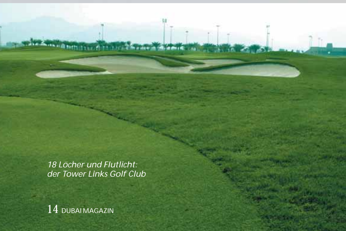
18 Löcher und Flutlicht: der Tower Links Golf Club

farbenfrohen und extravaganen Design ist auch für Touristen aus anderen Emiraten interessant: vom Dubai Airport sind es 60 Minuten und von Sharjah City nur 45 Minuten Fahrzeit zur Manar Mall.