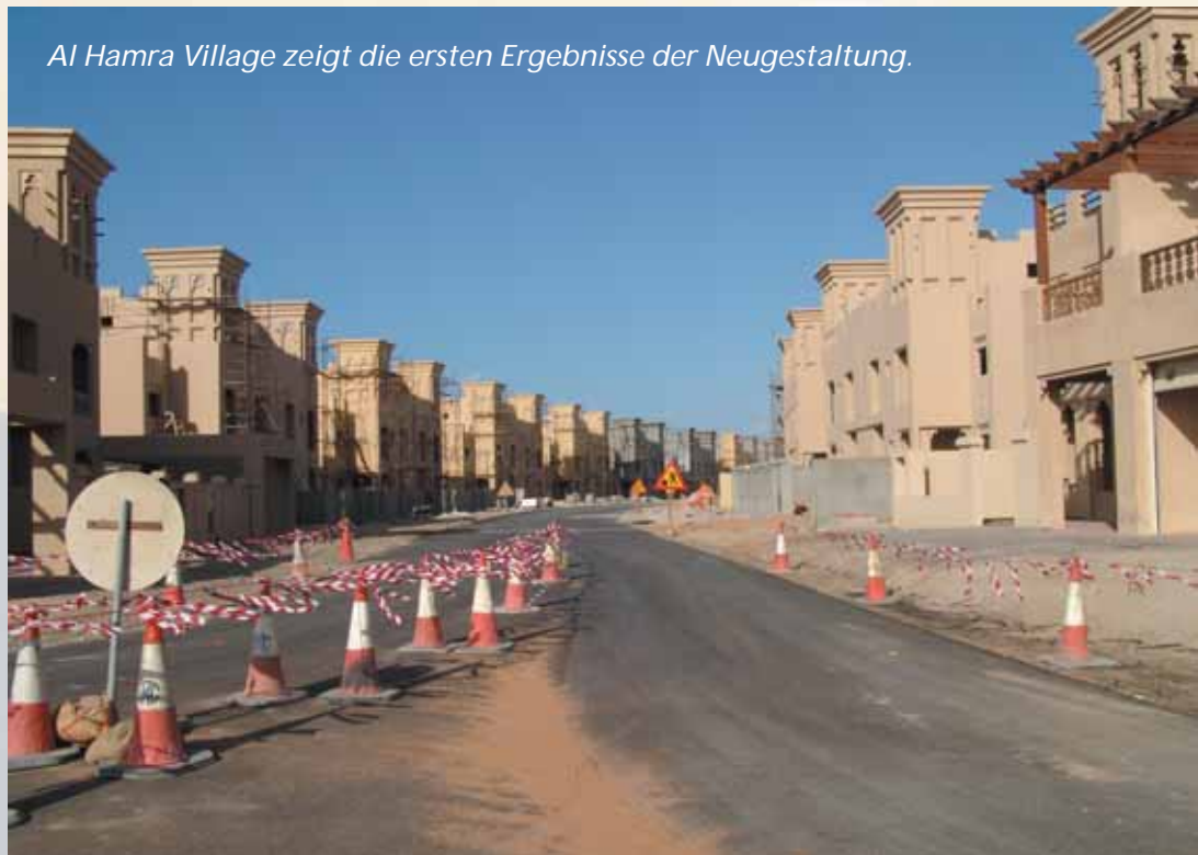
Al Hamra Village zeigt die ersten Ergebnisse der Neugestaltung.

Die Ortschaft Rams wurde 1819 von den Briten als Ausgangspunkt für die Invasion in die südliche Golfregion ausgewählt. Die Einwohner flohen nach Dhayah und mussten sich nach vier Tagen voller erbitterten Kampfhandlungen ergeben. Etwa 15 km von Rams entfernt befinden sich die Ruinen des Forts von Dhayah . Auch hier wurden zahlreiche historische Funde gemacht. Bei Forschungen entdeckten Archäologen Siedlungsreste aus dem 2. Jahrtausend v. Chr. und große oberirdische Gemeinschaftsgräber. Lange zurückreichende historische Wurzeln besitzt auch der kleine Ort Ghalilah . Heute ist der Ort allerdings durch modernste Industrie geprägt. Neben dem Industriehafen Mina Saqr sorgen in der Industriezone Khor Khunwair und im Industrial Park (Teil der Ras al-Khaimah-Freihandelszone) zahlreiche Firmen und Fabri-