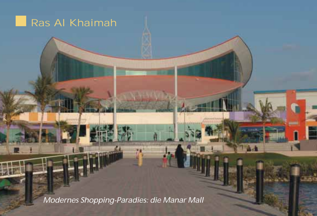
Modernes Shopping-Paradies: die Manar Mall