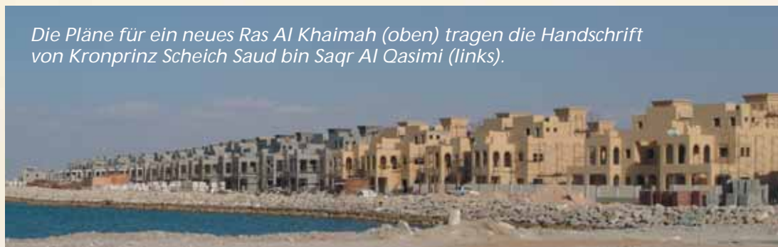
Die Pläne für ein neues Ras Al Khaimah (oben) tragen die Handschrift von Kronprinz Scheich Saud bin Saqr Al Qasimi (links).