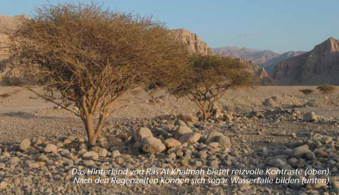
Das Hinterland von Ras Al Khaimah bietet reizvolle Kontraste (oben). Nach den Regenzeiten können sich sogar Wasserfälle bilden (unten).